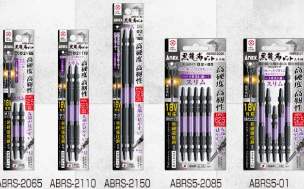
ABRS-2065 ABRS-2110 ABRS-2150 ABR5-2085 ABR5-01